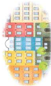
ที่ว่าการอำเภอเมืองหนองบัวลำภู