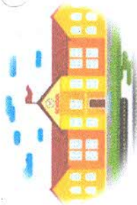
โรงเรียนหนองบัวพิทยาคาร