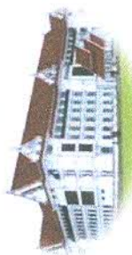
สพป.หนองบัวลำภู เขต ๑