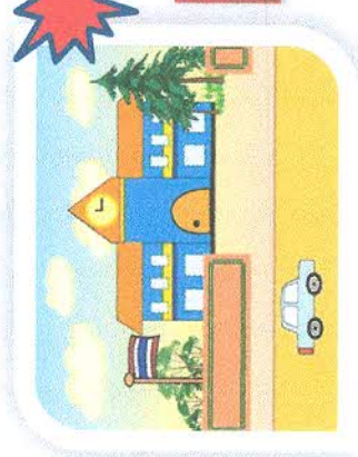
สนามสอบ โรงเรียนหนองบัววิทยายน