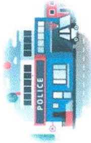
สถานีตำรวจภูธรจังหวัดหนองบัวลำภู