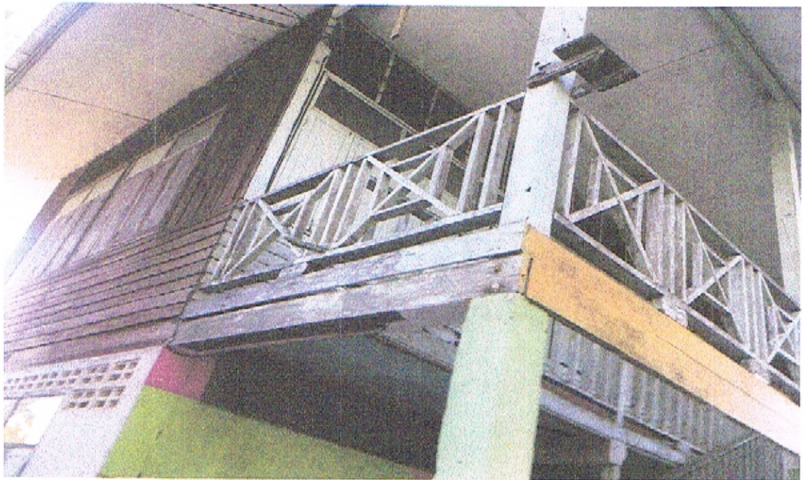
ภาพถ่ายด้านขวา