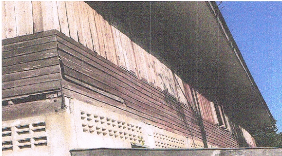
ภาพถ่ายด้านหลังอาคาร