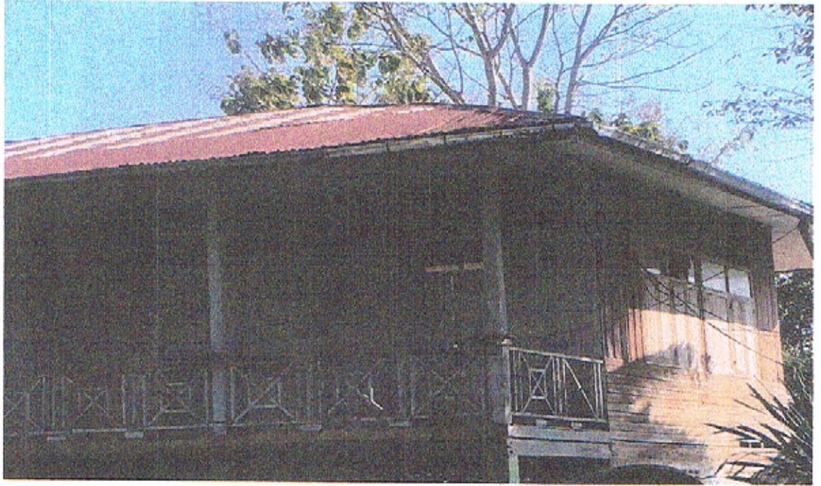
ภาพถ่ายด้านซ้าย